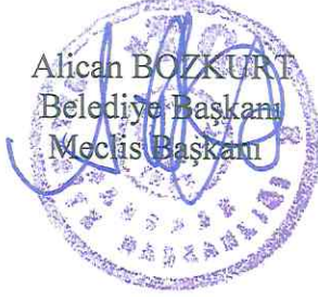
Alican BOZKURT Belediye Başkanı Meclis Başkanı

Yapılan görüřmeler ve alınan bilgiler neticesinde Malatya İli Darende İlçesi Karabacak Mahallesiinde 114 ada 21 parselde krokide A1 ile gösterilen, 119 ada 3 parselde krokide A2 ile gösterilen, 146 ada 1 parselde krokide A3 ile gösterilen, 145 ada 1 parselde krokide A4 ile gösterilen, 142 ada 86 parselde krokide A5 ve A6 ile gösterilen 141 ada 27 parselde krokide A7 ve A8 olarak gösterilen alanların Karabacak Mahallesiinde mevcut yerleşim alanının nüfusa yeterli olmaması sebebiyle yeni yerleşim alanları belirlenip imar planı yapılması için 4342 sayılı Mera Kanununun 14. Maddesine istinaden tahsis amacı deęişikliği işlemlerinin başlatılmasına katılanların, Oy birlięiyle karar verilmiştir.